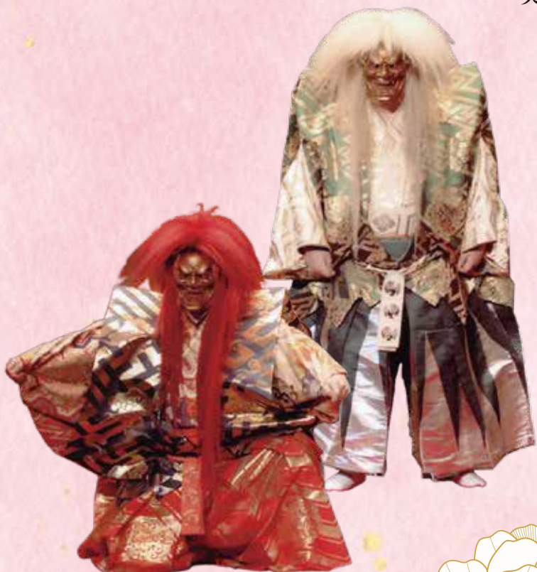
能「石橋」(観世流)