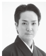
佐辺良和 (さなべよしかず)

紀伊国(和歌山県)道成寺で、釣鐘の再興供養を行うことになりました。そこに白拍子が現れ、鐘を拝みたいと頼むので、能力は舞を見せることを条件に白拍子を境内に入れます。白拍子は舞(乱拍子)を舞いながら鐘楼へ近づき、人々が眠った隙を見て鐘を引き落とし、その中へ消えてしまいます。鐘が落ちた音に驚いた能力はこの事態を住僧に知らせます。住僧が鐘に向かい一心に祈ると、鐘は再び上がり、中から蛇体が現われます。そして僧たちと激しく争いますが、やがて祈り伏せられ、日高川に飛び込み姿を消すのでした。