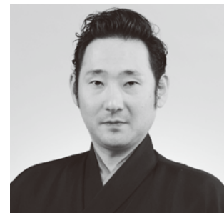
山本則重 (やまもとのりしげ)

1998年紫綬褒章受章。2007年日本芸術院賞受賞等、受賞多数。重要無形文化財各個認定保持者(人間国宝)。