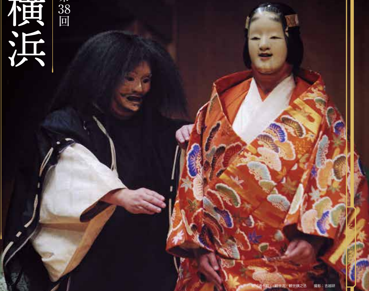
能「通小町」(観世流) 観世鏡之丞