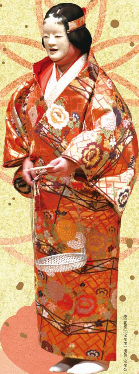
能花筐(宝生流)提供・宝生会

※電話・WEB予約開始日にチケットが売り切れた場合、窓口での販売はございません。