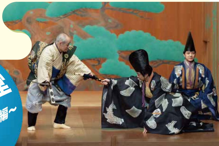
狂言「二人大名」(和泉流)