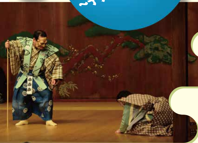
狂言「清水」(和泉流)