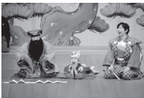
狂言「居杭」(大藏流)