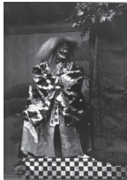
能「紅葉狩」(観世流)

妻がほしい男が夢のお告げで妻を得ようとする「二九十八」と、かぶると姿が消える頭巾を手に入れた居杭のいたずらに注目の「居杭」の2曲を、京都より茂山千五郎家を迎えてお送りします。