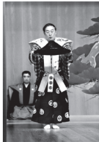
狂言「隠笠」(大藏流) 山本東次郎