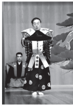
狂言「隠笠」(大藏流) 山本東次郎

すっぱ(詐欺師)から姿の消える隠れ笠だと普通の笠を売りつけられた太郎冠者の行動に注目の「隠笠」と、檀家の頼みごとを断るための住職と見習い僧とのやり取りが面白い「骨皮」の2曲を、毎回好評の山本東次郎のお話とともにお送りします。