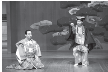
狂言「魚説経」(大藏流)

元漁師のにわか出家が苦し紛れに魚の名づくしの説経を語る「魚説経」と、「金の値」と「鐘の音」を聞き違えた太郎冠者が寺々をめぐり鐘の音を聞き比べる様子が面白い「鐘の音」の2曲を、京都より茂山千五郎家を迎えてお送りします。